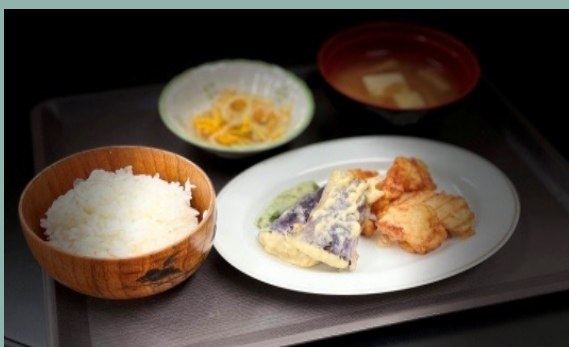
* 写真のメニューは鶏天定食

1日利用の方には日替わりメニューで昼食を提供させていただきます。ボリューム満点で利用者には好評です ご自身でお弁当などを持参も可能です。